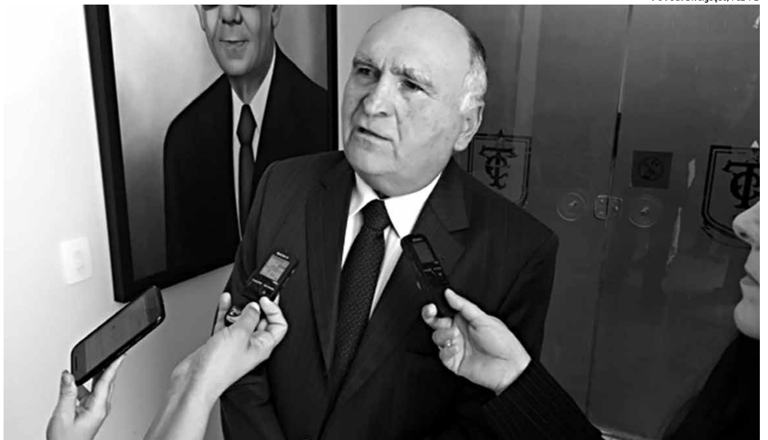
Nominando Diniz, conselheiro do Tribunal de Contas do Estado, faz alerta sobre prejuízos ambientais e também à saúde pública

“O primeiro despejo ocorre em frente ao Bar do Cuzcuz e, o outro, diante do Hotel Verde Green”, observou o conselheiro ao ressaltar o fato de que o problema traz prejuízos ambientais e, não menos, à saúde pública.