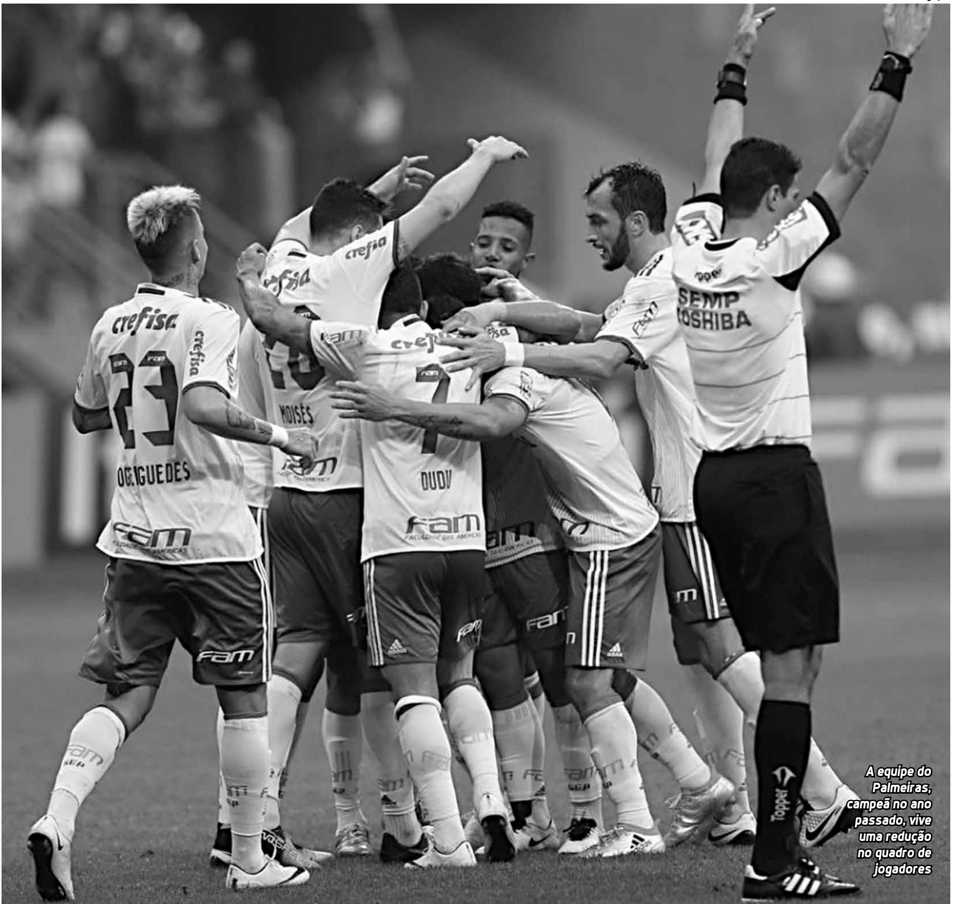
A equipe do Palmeiras, campeão no ano passado, vive uma redução no quadro de jogadores

“Mostramos que este grupo faz a diferença. Os outros que entraram mantiveram o mesmo nível de atuação; isso mostra que o grupo é vitorioso. Tomara que continue junto conosco, que consigamos títulos e vitórias”, finalizou.