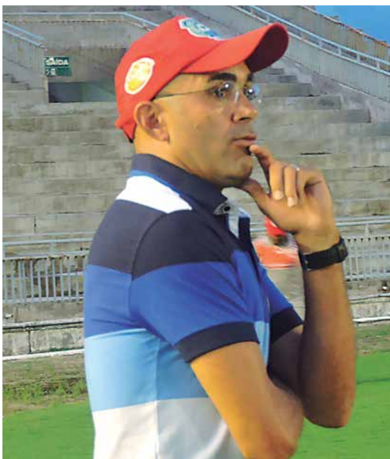
Maia disse que o Auto Esporte tem condições de dar a volta por cima

Apenas dois pontos, em cinco jogos, e enfrentando a lanterna do Campeonato Paraibano. Uma campanha que nem o mais pessimista torcedor do Auto Esporte poderia imaginar. Mesmo neste terrível momento, o técnico interino Maia não vê motivos para desespero, e acredita da recuperação da equipe, nos próximos jogos.