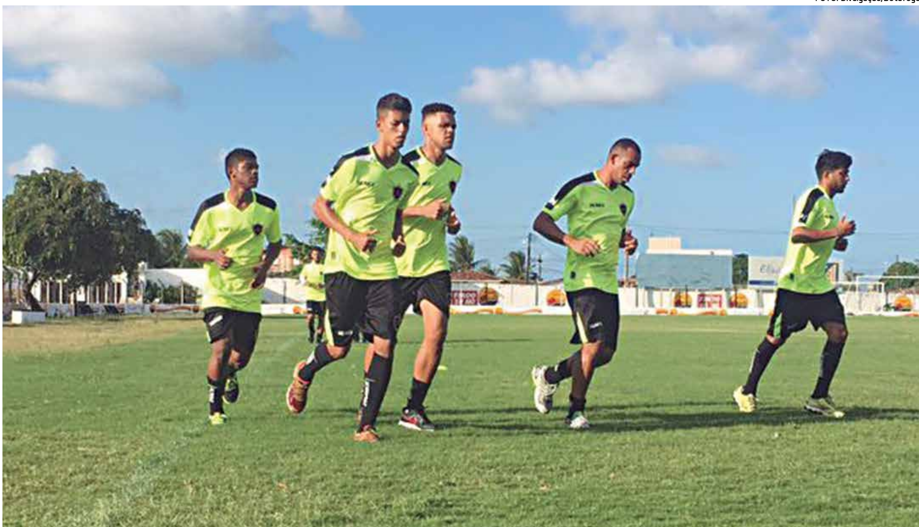
Jogadores do Botafogo durante treino físico na Maravilha do Contorno visando a estreia do time nas disputas da Copa do Nordeste hoje contra o América em Natal