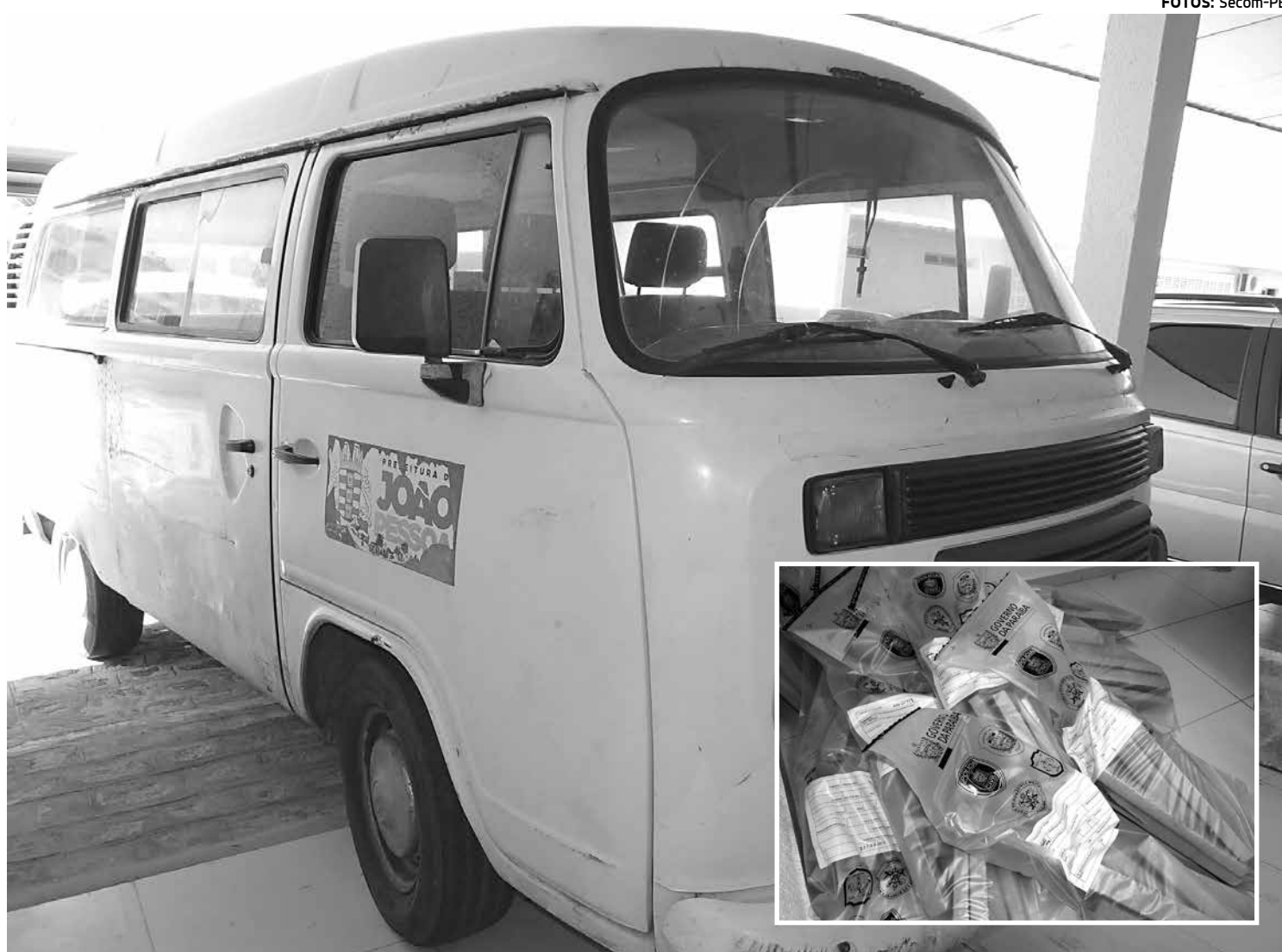
Kombi tinha adesivo da Prefeitura de João Pessoa, mas polícia ainda investiga se veículo pertence realmente ao poder público