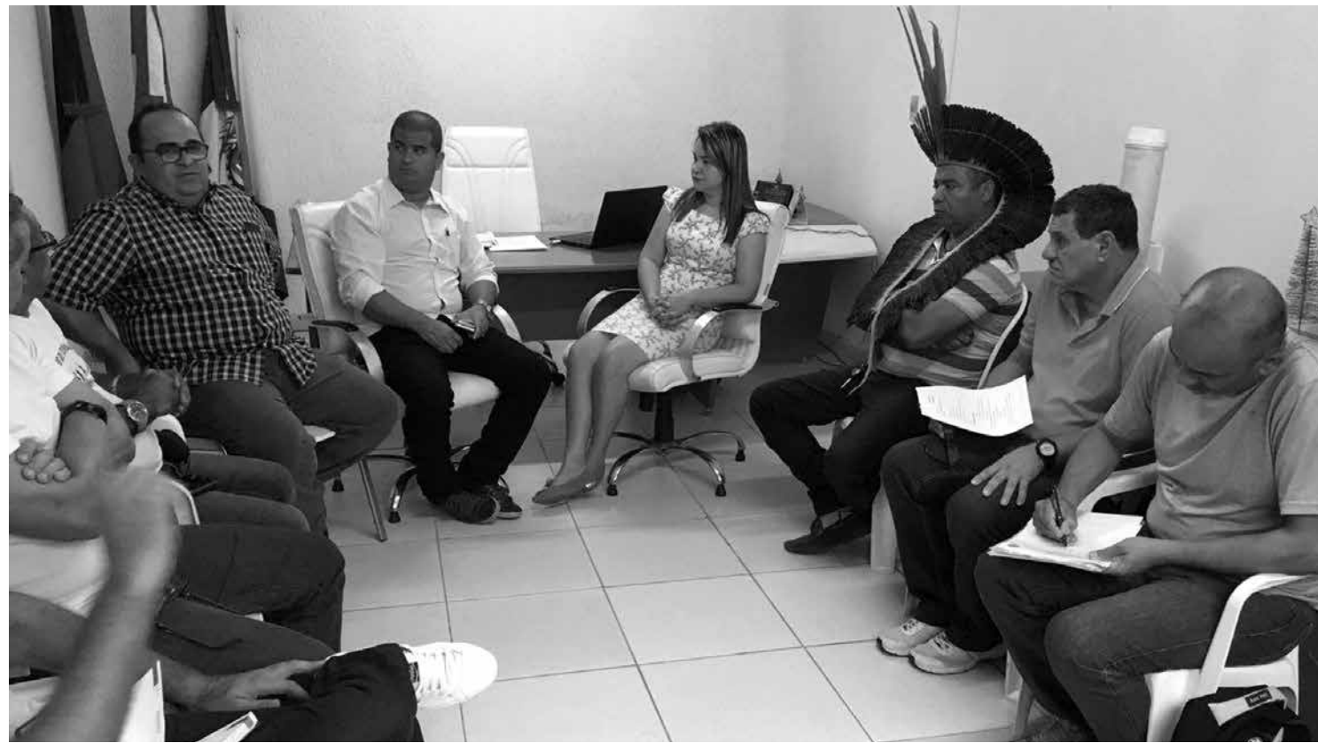
Representantes de tribos indígenas estiveram na Sejel-PB, ocasião em que discutiram com o Governo a realização da competição

Agora chegou a hora. Os jogadores estão supermotivados e o bom início no Paraibano, onde lidera a competição depois de cinco rodadas, anima o torcedor. E o fato de estreiar fora de casa contra o América, no Castelão, não assusta o torcedor. Todos estão confiantes em conquistar uma vitória para apagar as más participações. Ano passado, na estreia, perdeu de 2 a 1 para o Sport jogando no Almeidão. No ano anterior, derrota também em casa, desta vez para o River. Em 2014 empatou em casa com o Sport. Como se vê nenhuma vitória na primeira rodada. Estreando fora, quem sabe se o Belo não quebra o tabu de não vencer na primeira rodada. A diretoria formou, mais uma vez, um bom elenco e vamos torcer para que seja o ano do Botafogo na Copa do Nordeste e no Campeonato Brasileiro. Além de buscar uma grande performance na Copa do Nordeste, o Botafogo tem uma aspiração maior nesta temporada: o acesso à Série B do Campeonato Brasileiro que esteve tão perto no ano passado. É dia de torcer pelo Belo e que venha a primeira vitória.