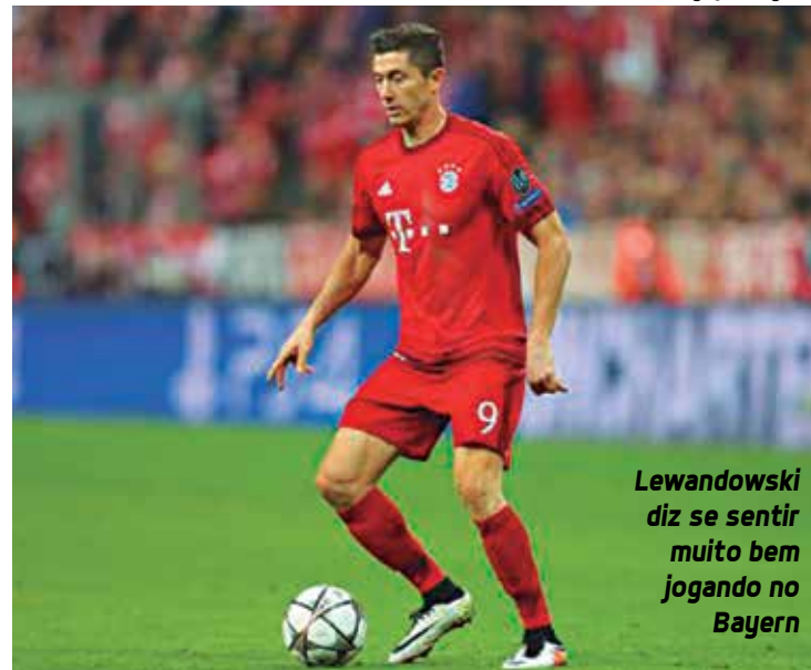
Lewandowski diz se sentir muito bem jogando no Bayern