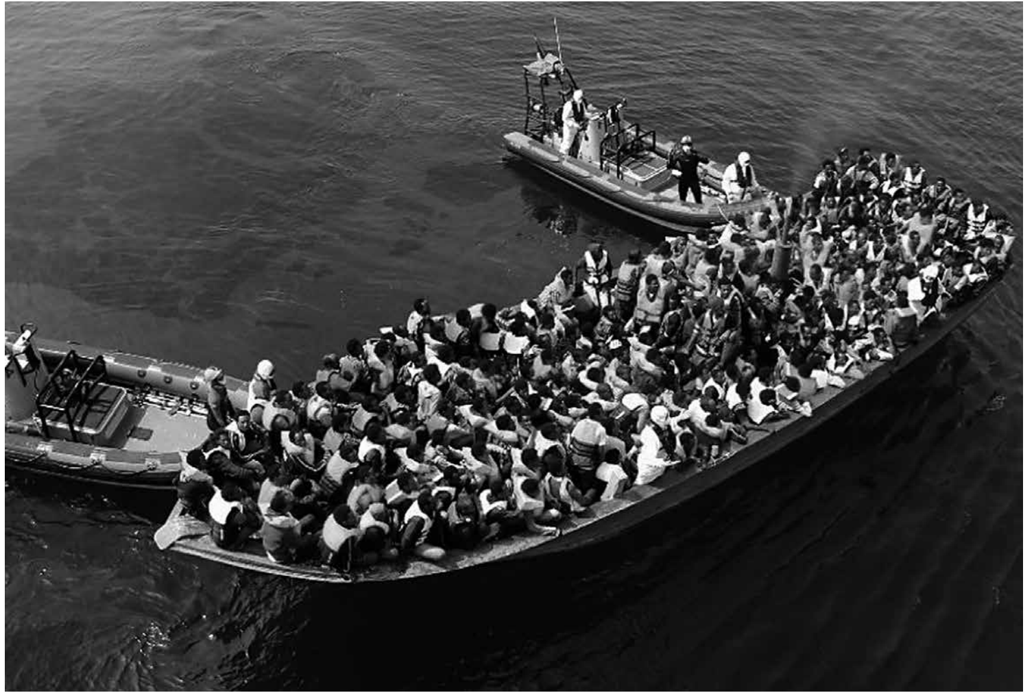
O Mar Mediterrâneo, que tem sido palco de muitas mortes, se tornou a principal travessia de refugiados para chegar a países europeus

Nos próximos dias, outras medidas relacionadas à imigração devem ser anunciadas pelo presidente americano.