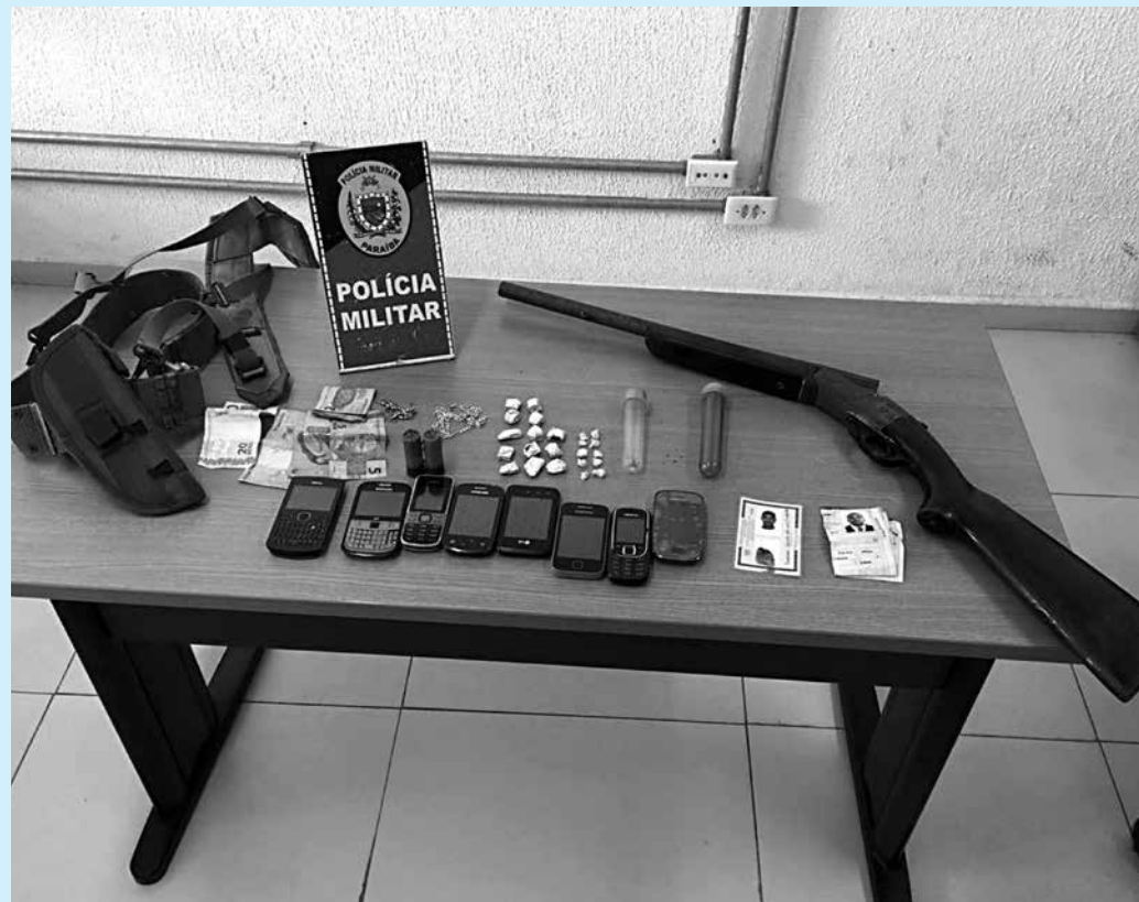
Foram encontrados uma espingarda, pedras de crack, maconha e vários telefones celular