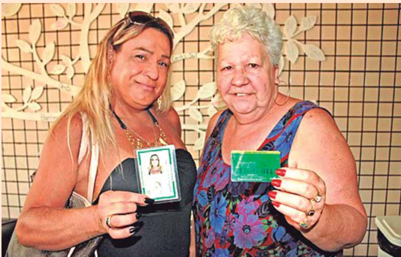
SUS realiza desde 2008 cirurgias de redesignação sexual, além de ofertar outros procedimentos cirúrgicos

mudança de sexo do masculino para o feminino cresceu 48% de 23, em 2015, para 34 em 2016. A terapia hormonal no processo transexualizador também subiu de 52 para 149 procedimentos, aumento de 187%.