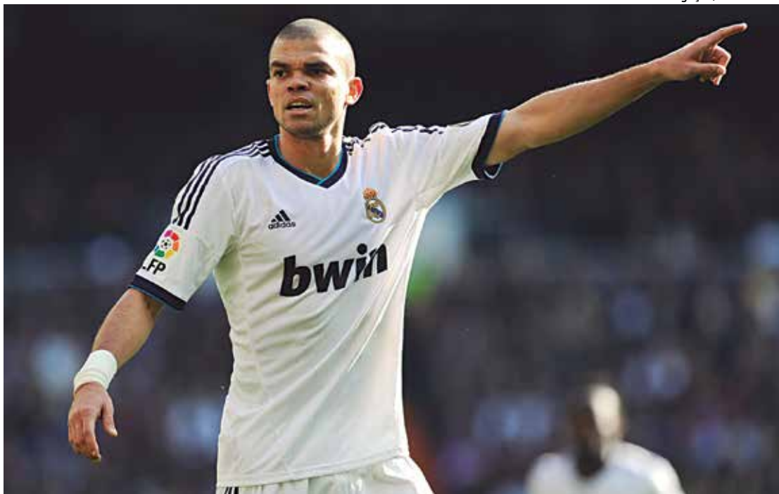
O zagueiro Pepe encerra o seu contrato com o Real Madrid em junho e já avisou que sai do clube

Depois de ter sido eleito o melhor jogador do mundo de 2016 pela Revista France