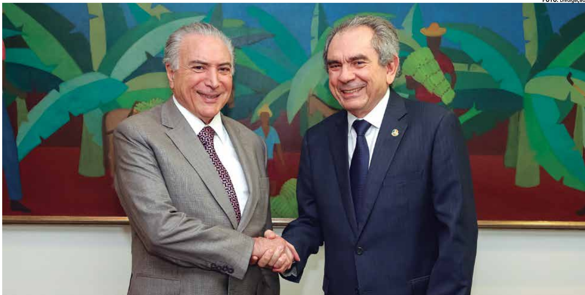
Após inauguração no município de Floresta-PE, Michel Temer, Hélder Barbalho, Raimundo Lira e demais integrantes da comitiva visitam obras em barragens no Cariri

Após a inauguração, o senador Lira, junto com outros parlamentares, acompanhará o ministro Hélder Barbalho na inspeção que será feita na Barragem de Poções, em Monteiro-PB; e na Barragem de Camalaú, também no Cariri paraibano.