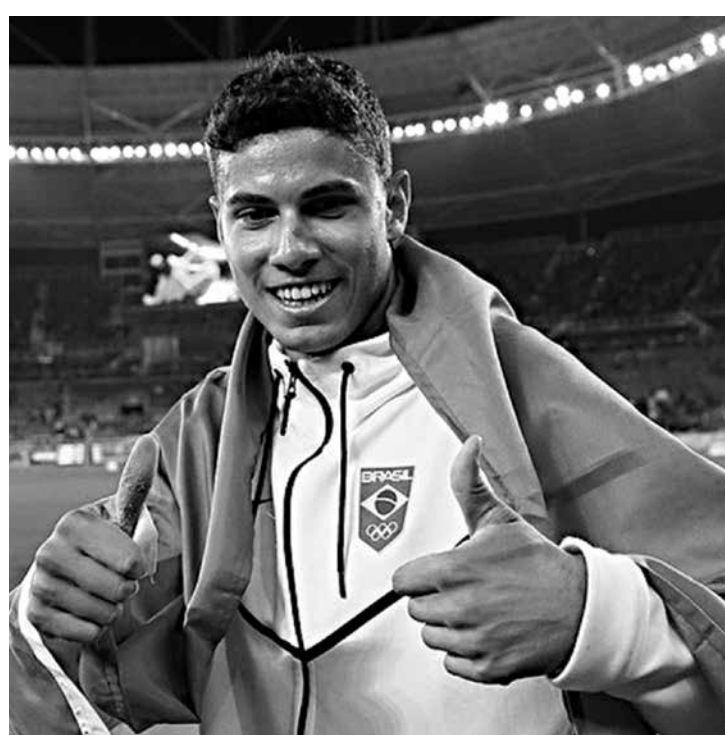
Brasileiro é campeão olímpico e tem agenda cheia na temporada

Para a estreia na temporada, o atleta nascido em Marília (SP), que completou 23 anos em dezembro, espera fazer uma boa avaliação sobre o seu estágio de treinos, iniciados em Fómia, na Itália, onde mora desde 2014. “Começo de temporada é sempre especial. Estou treinando bem e espero conseguir um bom desempenho”, afirmou ele, em entrevista a jornalista.