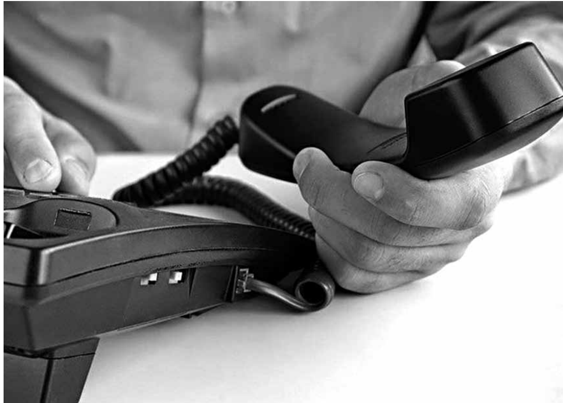
Anatel autorizou as operadoras a elevar a tarifa e aumento será aplicado a partir da próxima semana

De acordo com a Anatel, o último reajuste aplicado ao plano básico de serviço das concessionárias de telefonia fixa para chamadas para telefonia móvel ou trunking (comunicação por rádio) foi em 29 de setembro de 2015.